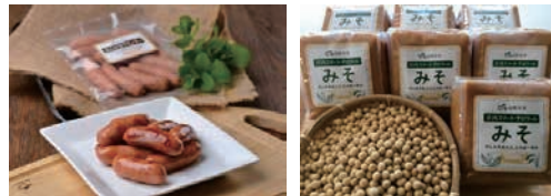
プロジェクトで開発し、販売しているウイナーソーセージと味噌