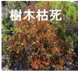
写真：小笠原の調査地で乾燥により枯死した樹木

樹木は光合成で取り入れた炭素を呼吸として放出し、根で吸収した水を葉の蒸散で放出します。こうした機能（生理機能）が健全だと樹木は生長し、不健全だと枯死につながります。そこで私たちは生理機能を測定することで樹木が生長・枯死する詳細なメカニズムの解明を行っています。