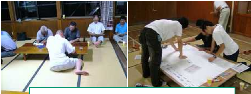
自分たちの地域のことを真剣に考えています そしてできたのはたくさんの道筋