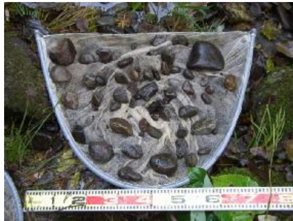
図2 産卵床を構成していた礫石の一部