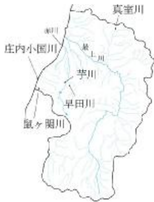
図1 産卵床調査河川位置図