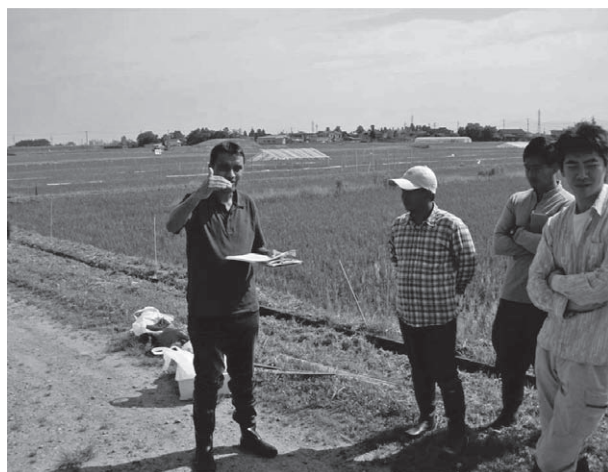
図7 JICA 長期研修生の研究風景、山形大学農学部附属やまがたフィールド科学センターにて日本人学生と協力して研究を実施