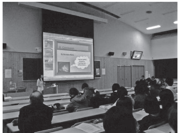
図1 JENESYSプログラム留学生による研究発表

山形大学は各局(学部)における「到達目標を明確にした自己実現学習システム」を支援する目的で、教育改革支援制度(YU - GP制度)を制定し、毎年その支援対象を学内公募により選考している。平成22年度に農学部が採択された課題は、「英語によるプレゼンテーション能力の向上」である。これは、国際的に活躍が期待される人材の育成を視野に、学生の英語によるプレゼンテーションおよびコミュニケーション能力の上達と発展途上国を対象とする国際理解を目指すものである。具体的には、ネイティブスピーカーによる英語演習(Intensive Scientific Communication Course in English)、JICA職員による発展途上国の農業問題に関する講義(国際フィールド協力論I)、外務省職員による国際理解に関する講義(外交講座)、21世紀東アジア青少年大交流計画(JENESYSプログラム)に係る「農・食連携環境保全教育研究支援プログラム」にて受け入れを行っている留学生と共同でワークショップを開催(図1)、山形大学農学部において開催した国際シンポジウム(東アジア食料生命環境科学国際シンポ