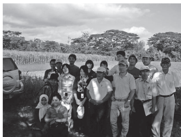
図5 学生の海外渡航、インドネシア ガジャマダ大学訪問および現地圃場の視察（平成21年12月7日から12月12日）

海外派遣に関する大学からの資金面での支援制度には、山形大学小嶋国際学術交流基金（本学大学院生および教職員対象、各部局から1年1件を限度とし、海外渡航に係る片道の航空運賃を助成する）、女性教員の国際学会への旅費支援（本学女性教員対象、1年6名