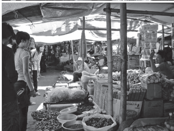
図4 サマースクール in ベトナム（平成21年8月19日から8月25日に実施） 上段：ハノイ農業大学における交流セミナー、下段：市場の見学

生がいるが支援は各研究室に依存している（図5）。平成20年度の海外渡航延べ人数は学部生1名、大学院生7名、平成21年度の海外渡航延べ人数は学部生16名、大学院生6名であった（表1）。