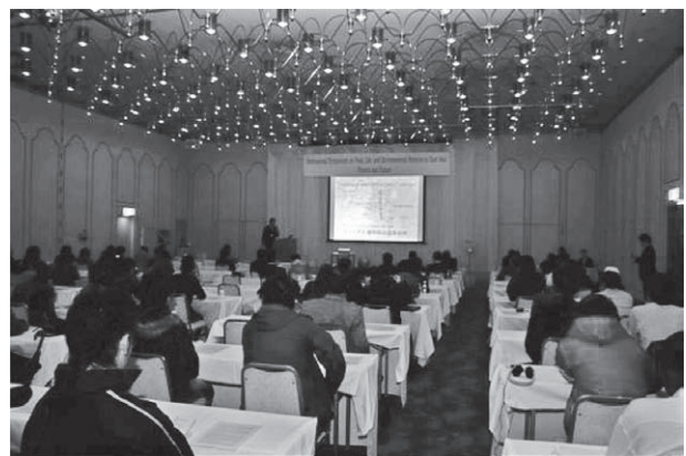
図2 東アジア食料生命環境科学国際シンポジウム(平成22年12月17日に開催)

ジウム:平成22年12月17日に実施、山形大学農学部、岩手大学大学院連合農学研究科、ベトナム ハノイ農業大学、インドネシア ガジャマダ大学、タイ キングモンクット工科大学、中国 延辺大学、韓国 大邱大学の大学教員および大学院生が講演、図2)への参加を通して、実践的な英語によるプレゼンテーション能力と国際力を備えた学生を育成するものである。これらの取り組みにおいて実際に学生を指導するのは、研究分野の指導教員やJENESYSプログラムの留学生受け入れ教員である。