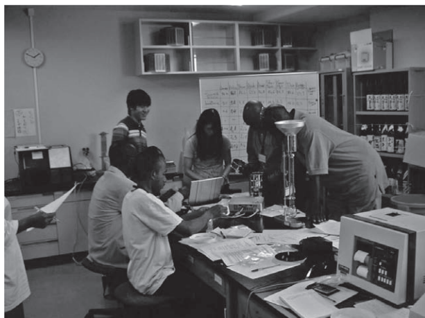
図6 JICA 短期研修生の研修風景、大学院生を講師に米の品質測定方法を実習

取り組みの成果として、学生の海外渡航人数や留学生の受け入れ人数は平成21年度から急増したところであり、今後も取り組みを継続する予定である。しかし、継続には予算確保が重要な課題となる。予算確保のために、アジア・アフリカ学術基盤形成事業への応募、JENESYSプログラムへの申請、JICAとの連携、サマースクールやシンポジウム開催への後援会組織からの資金援助が行われているが、今後もそれらを継続する必要があると考えられる。さらに、山形大学農学部における国際協力に関する取り組みが活発に持続されるために、JICAとの連携や地元自治体を実施する国際協力との連携を調整する専任のコーディネーターを配置することや、国際協力に取り組む必要性を教職員全体で認識する必要があると思われる。